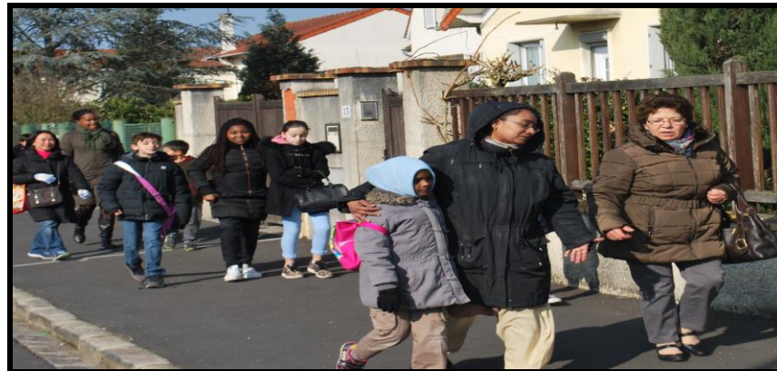
UN TEMPS D'ARRÊT POUR SE RASSEMBLER AVEC LES FAMILLES ATTENDANT A SAINT LEGER

EN MARCHE DEPUIS NOTRE DAME DE LA PLAINE VERS LA CHAPELLE DU BOIS CLARY