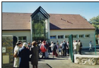
Salles Paroissiales 3 Ter, rue Mercière