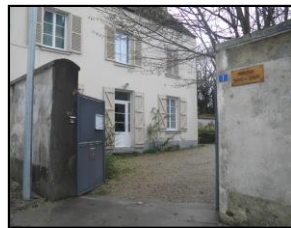
Presbytere 1, rue Mercière