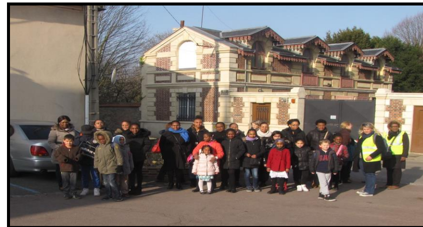
EN MARCHE VERS LA SEMAINE SAINTE - LES RAMEAUX A NOTRE DAME DE LA PLAINE